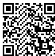
单位会员身份查询和入会申请二维码

申报单位须为中国公路学会单位会员，且为技术独家持有单位，具有独立法人资格。非单位会员申报资料不予受理。